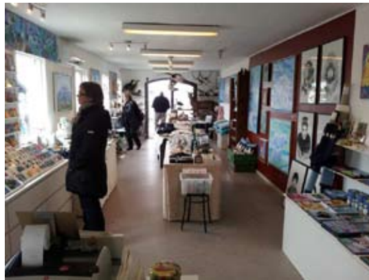
Et kik ind i Galleri og butik på 48 m2