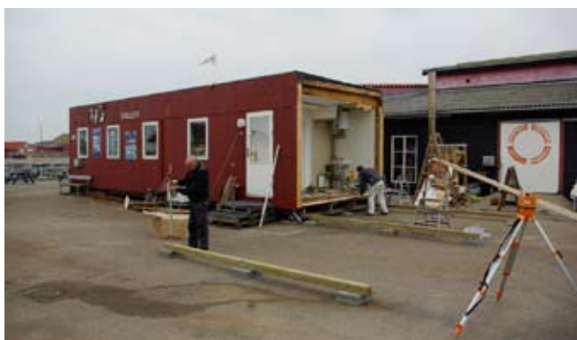
Så den kan kobles sammen med den nye pavillon