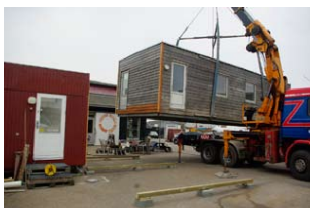
Her kommer den nye pavillon på en blokvogn