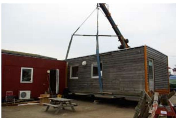
Den vejer 10 tons. Fantastisk at man kan løfte den.