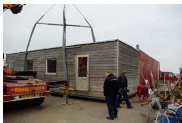
Så er den sat på plads op imod den gamle pavillon