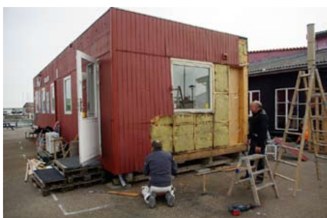
Den gamle pavillon få fjernet endevæg

Pladsen var blevet for trang i min pavillon nr. 1 med Galleri / butik om sommeren og værksted om vinteren. Min drøm gik i opfyldelse da jeg købte pavillon nr. 2. Den kom fra Nordjylland og blev kørt igennem hele Danmark. Den blev koblet på den første pavillon som en to længet bondegård. Der blev åbnet imellem dem, så jeg frit kan gå til butik og værksted. Ialt 92 m2. Maj 2012.