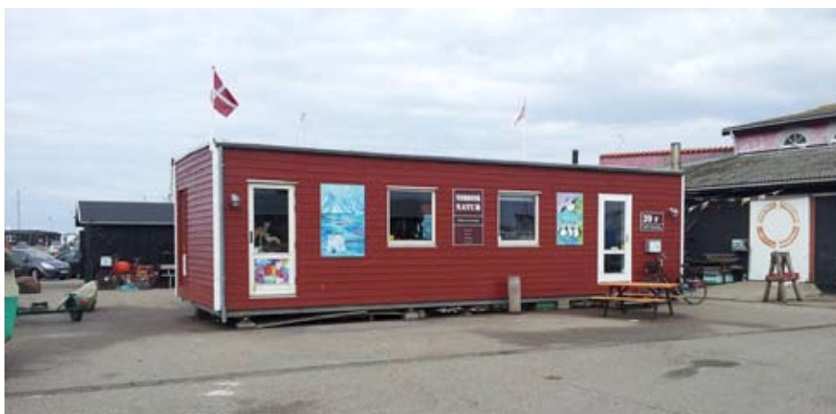
Så blev jeg færdig. Flaget er rejst og der er sat billeder udepå. Dette så mit værksted, set fra Nordre Beddingsvej.