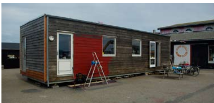
Den skal så lige grundes og males 2 gange. Puha - der var langt rundt