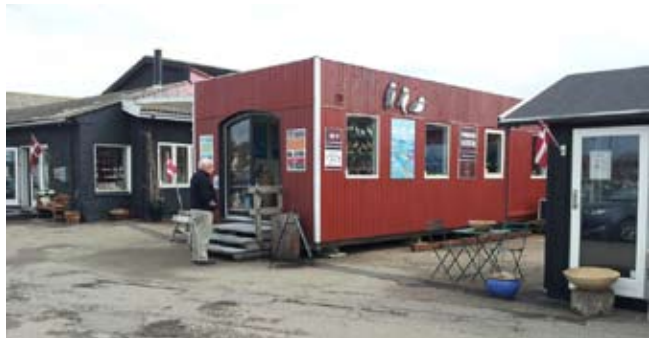
Indgang til Galleri og butik, set fra havnebassinet på midtermolen.